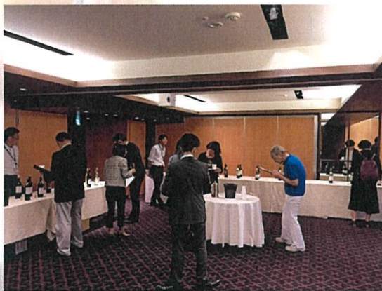
試飲会のイメージ

フリースタイル・テイステイングにて開催致します。 開催中、都合の良い時間帯に足をお運び頂き、 自由にテイステイングしていただくスタイルです。 この機会に、葡萄栽培・ワイン醸造といった造り手との 交流とともに、日之城製品及び、シャトーマルス シリーズを、ご自身で確かめていただければと考えて おります。